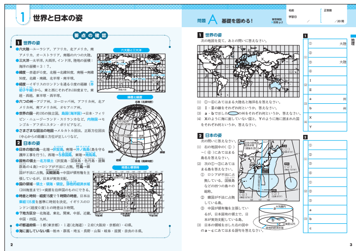
▲本誌（要点の確認、問題A）

各単元の要点をわかりやすくまとめた「要点の確認」と、一問一答形式の基本問題からなる「問題A」は見開きになっており、「要点の確認」を参考にしながら「問題A」を解くことで、各単元の学習内容の基礎・基本をしっかりと固めることができます。「問題B」では、入試によく出題される標準的な問題に取り組むことで、単元の内容をおさえ、実力を高めることができます。 また、地理、歴史、公民の各分野の終わりに