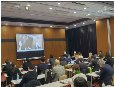
教科書著作権協会との契約改定の説明会

日本図書教材協会では、教育のICT化に伴う教材の開発・発行形態の多様化を受けてより教材が発行しやすくなるよう、教科書著作権協会と進めてきた「教科書準拠教材への教科書利用に関する基本契約書」の改定が昨年12月に合意したことを受けて、改定内容の周知を図るべく説明会を「出版クラブ」とオンラインで開催した。当日は、会場には教材編集者を中心に25社43名の参加があり、オンライン視聴は226名（アカウント数）の参加があった。