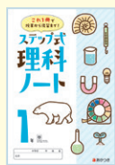
ステップ式 理科ノート