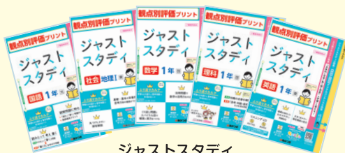
ジャストスタディ