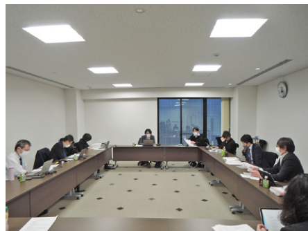
小学校編集部長会

当日は、教育現場のICT化に関する教育行政や自治体採択デジタル教材の動向、ブロック小学部会長からの要望事項、小学校業界に関する諸課題、複写複製・公衆送信対策等について協議、情報交換を行った。