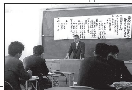
学校教材調査会スタート当時の様子

また第36期（小学校）の実施が1年延期されたことに伴い、1年延期での実施となります。