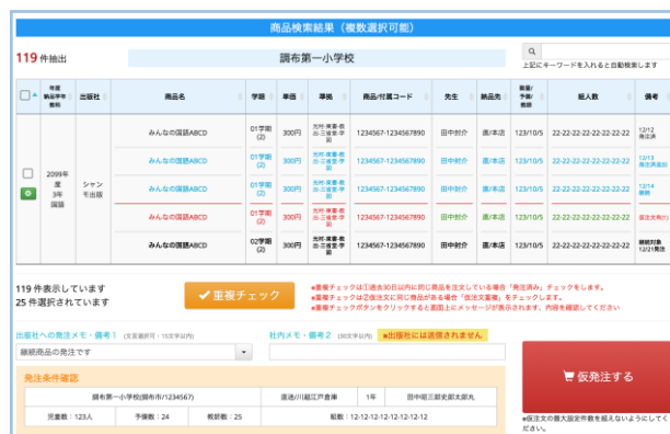
小学校継続発注画面

注文実績から継続発注したい商品を チェックして数量等の変更をして一括 で継続注文ができます。また2期制、 3学期制両方に対応しています。