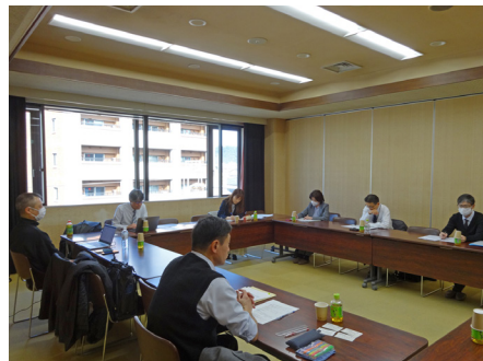
中学校編集部長会

衆送信に関する問い合わせへの対応、著作権に関する研修会等の開催、広報活動、ネットオークション対策等について状況確認と検討を行った。