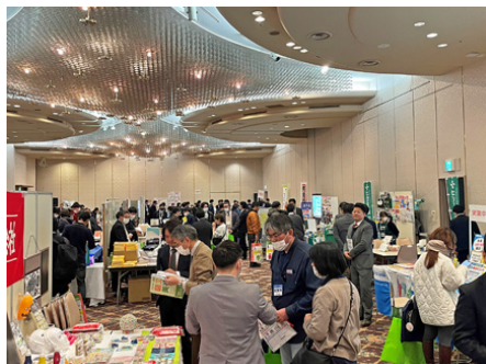
教材フェスティバル in 大阪

実演コーナーでは、デジタル教材の操作や、教具メーカーによる作品作り体験なども行われ、大いに盛り上がった。